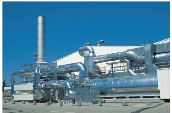
Abluftreinigung durch Adsorption.